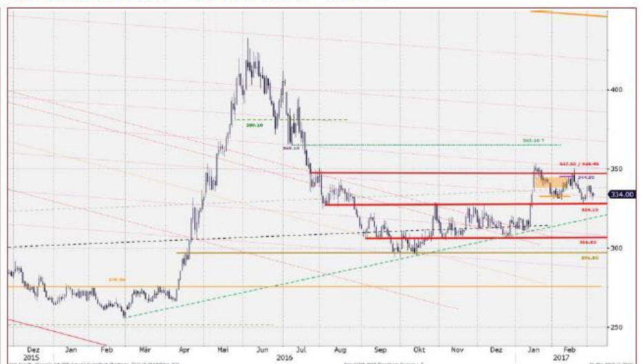
Sojaschrot (CBOT) USD/mT – Generischer Kontrakt – Tagesdaten

Der avisierte Fokus auf 337 setzte ein und 339,80 wurden im Wochenverlauf erreicht. Ohne Kurse über 339,40 und 342 verbleibt Schrot jedoch in seiner Seitwärtsrange mit Unterstützung 328,40. Zu Wochenbeginn könnte Schrot erneut versuchen, die 337 zu erreichen. Ohne Kurse darüber steht jedoch ggf. eine erneute Prüfung der 328,40 an. Damit als Signageber wichtig: 337 und 328,40. Innerhalb: Neutral