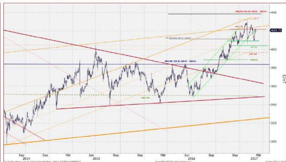
Raps MatIF €/mT – Generischer Kontrakt – Tagesdaten

Wie avisiert bleibt es im aktuellen Kontrakt ohne Kurse unter 403,75 positiv mit Fokus auf der übergeordnet gültigen 438,50 und der ebenfalls avisierten hohen Volatilität . Widerstand nun 421,75 . Solange 417 nicht unter- und in Folge 424,50 / 427,25 überschritten werden, sind die Widerstände 432,75 / 438,50 greifbar. Warnsignale nur unter 403,75 und negativ nur unter 388. Hohe Volatilität beachten!